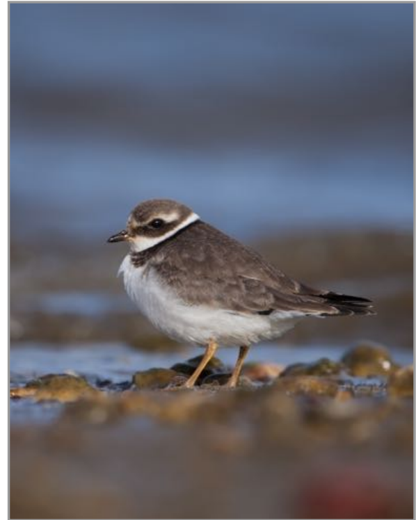
Píllara real - Chorlitejo grande - Charadrius hiaticula

La mejor forma de acceder a la playa de San Valentín es desde el Puente de las Pías (carretera FE-14), ya que este enclave se sitúa en su margen oriental. En el caso de la ensenada de Maniños tomaremos la carretera AC-133 que une el núcleo de Fene con el vecino municipio de Mugardos.