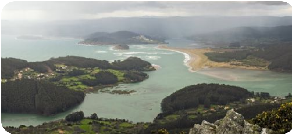
Ría de Ortigueira

Puerto de Ortigueira. Durante la bajamar este es un punto extraordinario de observación. Las enormes llanuras intermareales ofrecen alimento a diferentes especies de limícolas como la aguja colipinta, la aguja colinegra, el archibebe común y claro, los ostreros, el chorlito gris, el correlimos gordo, el correlimos común, el zarapito trinador y el zarapito real. Este último mantiene aquí una de las mejores poblaciones invernales del norte peninsular. También se pueden encontrar colimbos, serretas medianas, zampullines cuellinegros y grupos de espátulas alimentándose en los canales de la ría.