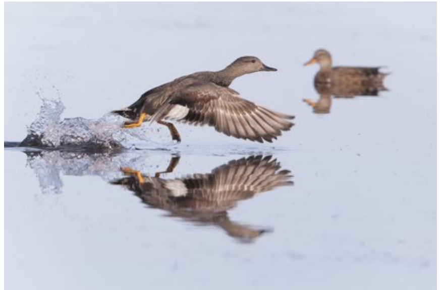
Pato frisado - ánade friso - Anas strepera

El amplio sistema dunar alberga aves tan interesantes como el escribano nival o el chorlito dorado y las concentraciones invernales de fringílidos, bisbitas y alondras son aquí muy notables.