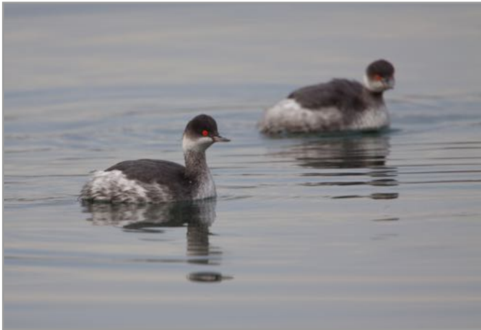
Mergullón de pescozo negro - Zampullín de cuello negro - Podiceps nigricollis

La playa de San Valentín, en Fene, es una buena opción para ver aves limícolas, como los correlimos, los chorlitejos o los andarrios, además de otras especies de aves marinas más comunes y gaviotas.