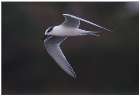
Carrán cristado - charrán patinegro - Sterna sandvicensis

O Porto de Cariño é un lugar excelente para avistar gaivotas. Aquí téñense observado ata 18 especies de láridos e en pleno inverno pódense ver algunhas gaivotas tan escasas como a gaivota polar ou a hiperbórea. Tamén inverna aquí o pilro escuro que se pode atopar entre as pedras dos espigóns. Outras especies como as gabitas ou os pilros comúns e tridáctilos son tamén habituais.