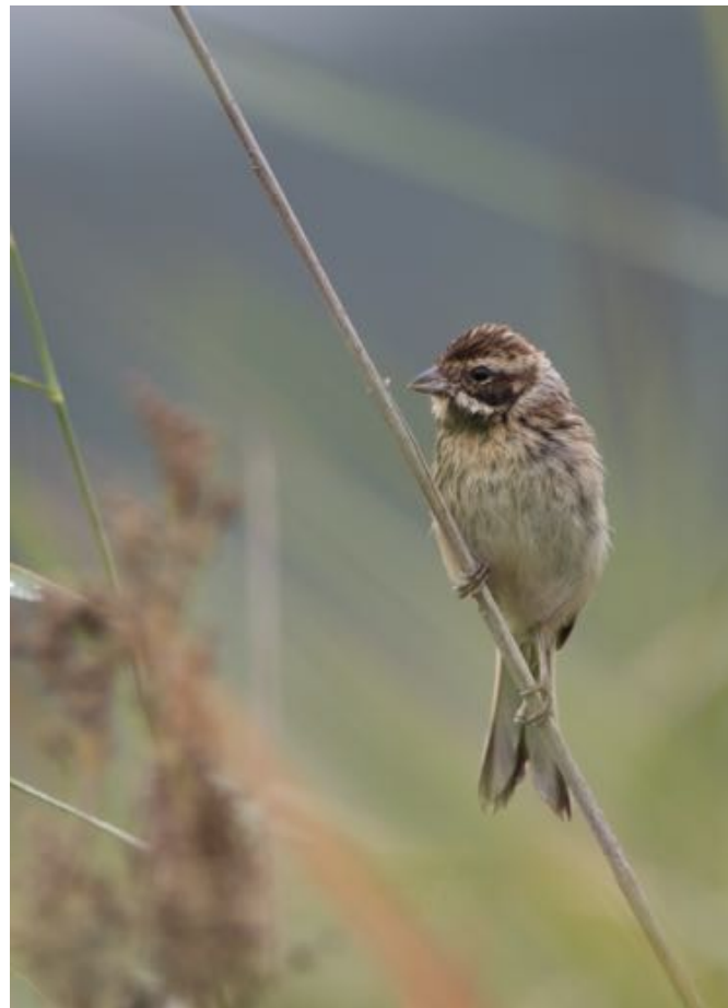
Emberiza shoeniclus lusitanica

O veciño encoro das Forcadas tamén merece unha visita.