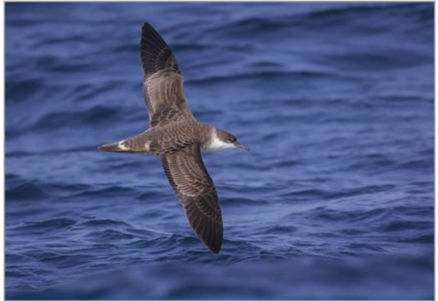
Pardela encapuchada - pardela capriotada - Puffinus gravis

Ao cabo accédese desde Porto do Barqueiro pola AC-100. Unha estrada alfartada que sae xunto ao faro de Estaca de Bares achéganos ao observatorio ornitolóxico.