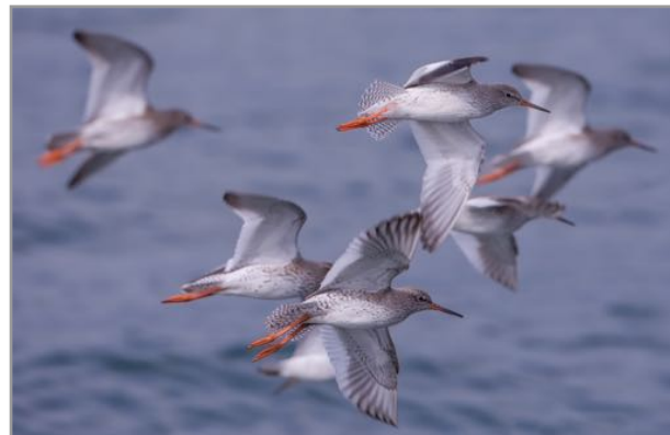
Bilurico patirrubio - archibebe común - Tringa totanus

Porto de Ortigueira. Durante a baixamar este é un extraordinario punto de observación. As enormes chairas intermareais ofrecen alimento a diferentes especies de limícolas como o mazarico rubio, o mazarico rabinegro, o bilurico patirrubio e claro, as gabitas, as píldoras cincentas, o pilro gordo, o pilro común, o mazarico chiador ou o mazarico real. Este último mantén aquí unha das mellores poboacións invernais do norte peninsular. Tamén é habitual atopar mobella grande, mergo cristado, mergullón de pescozo negro e grupos de cullereiros alimentándose nas canles da ría.