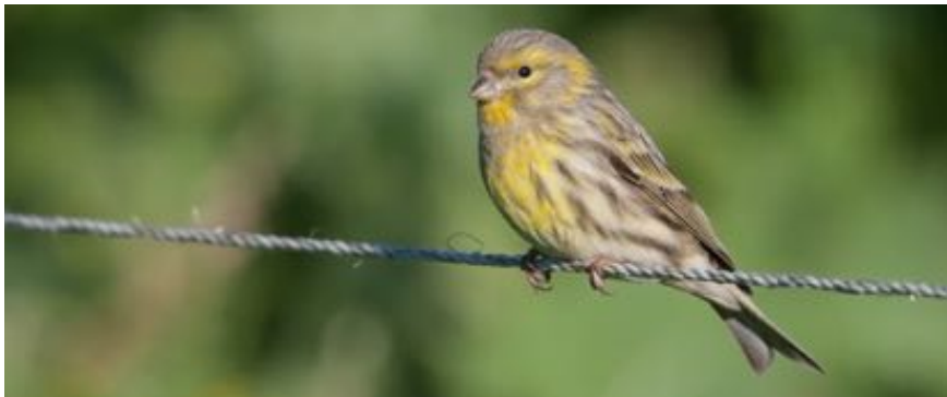
Verdecillo - xirín- Serinus serinus

Esta guía pretende dar a coñecer algúns dos puntos máis interesantes para a observación de aves, se ben é moi recomendable percorrer paseniño os 21 concellos que o forman para obter unha visión global da riqueza ornitolóxica da zona. Aínda que é a costa o sector con máis potencial, con enclaves tan interesantes como Estaca de Bares ou a Lagoa de Valdoviño, non debemos menoscar zonas do interior como son as Fragas do Eume ou os bosques de ribeira que xalonan moitos dos ríos e regatos que percorren este territorio. A lagoa artificial de As Pontes ou as serras interiores de O Forgoselo e A Faladoira ofrecen tamén boas posibilidades de observación de aves e gozan de importantes valores naturais e paisaxísticos.