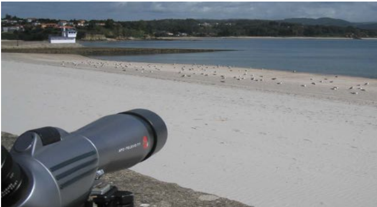
Praia de Ares - Playa de Ares

En invierno son los grandes láridos los dominantes en estas playas, descansan en grandes grupos formados por gaviotas patiamarillas, sombrías, arxénteas y gaviones: las playas de Pantín y Meirás son ideales para observalas.